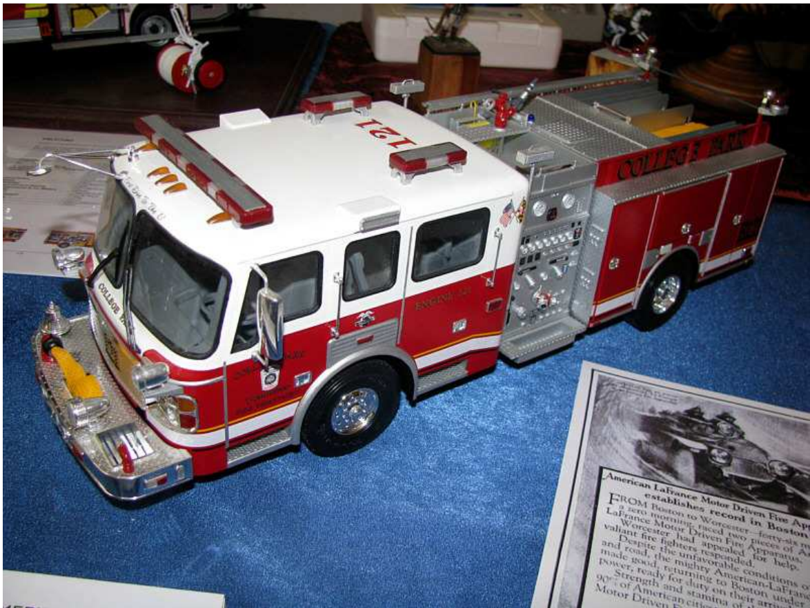
American LaFrance Feuerlöschfahrzeug