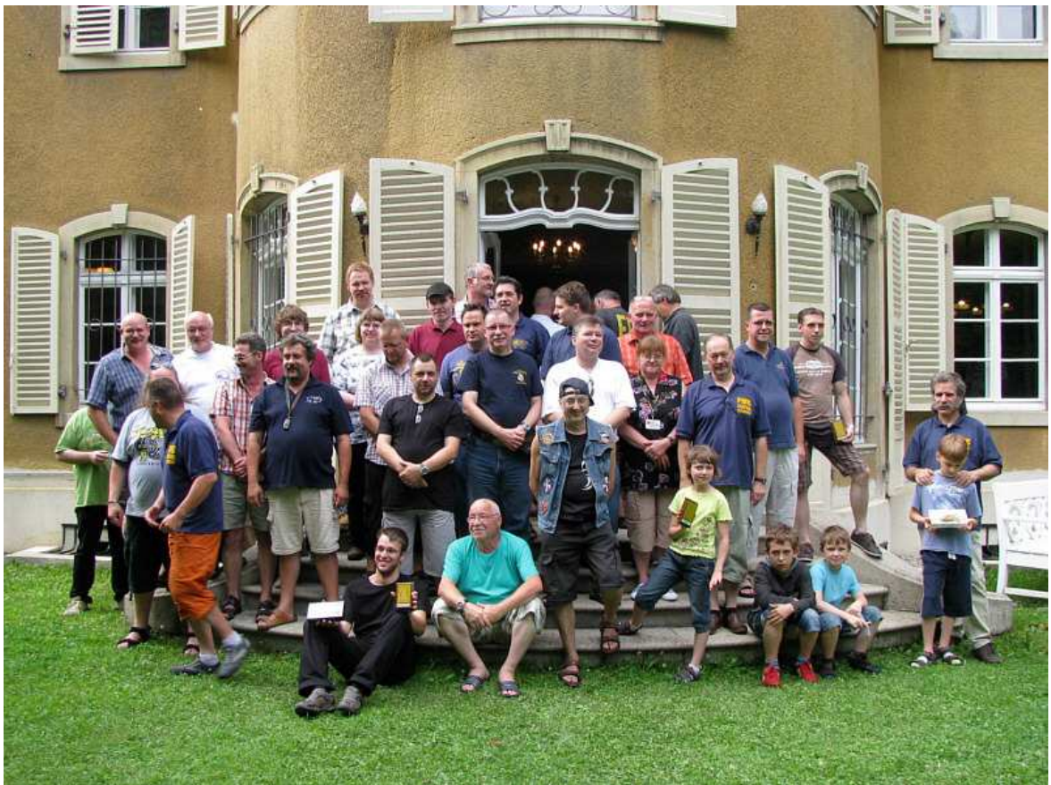
Gastgeber und Gäste versammeln sich für das Familienfoto