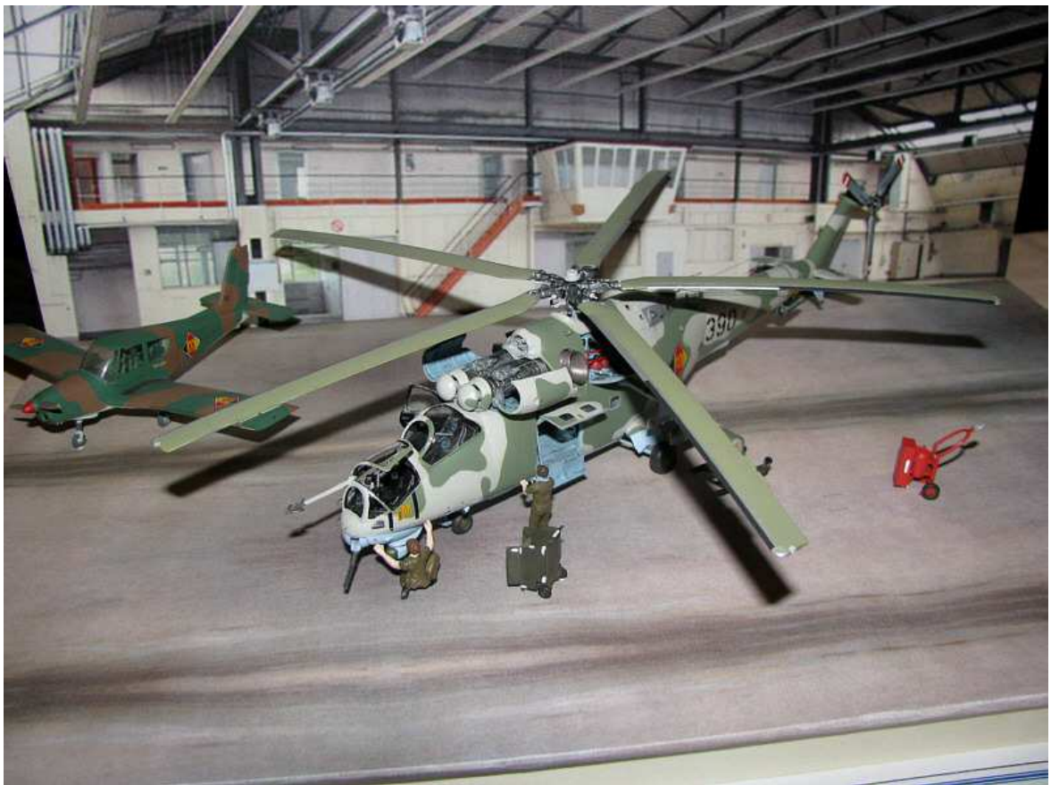
Mi 24 bei der Wartung