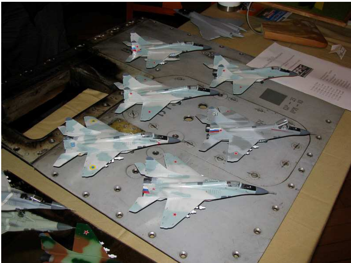
MiG 29 Flotte auf Originalteil des Flugzeugs