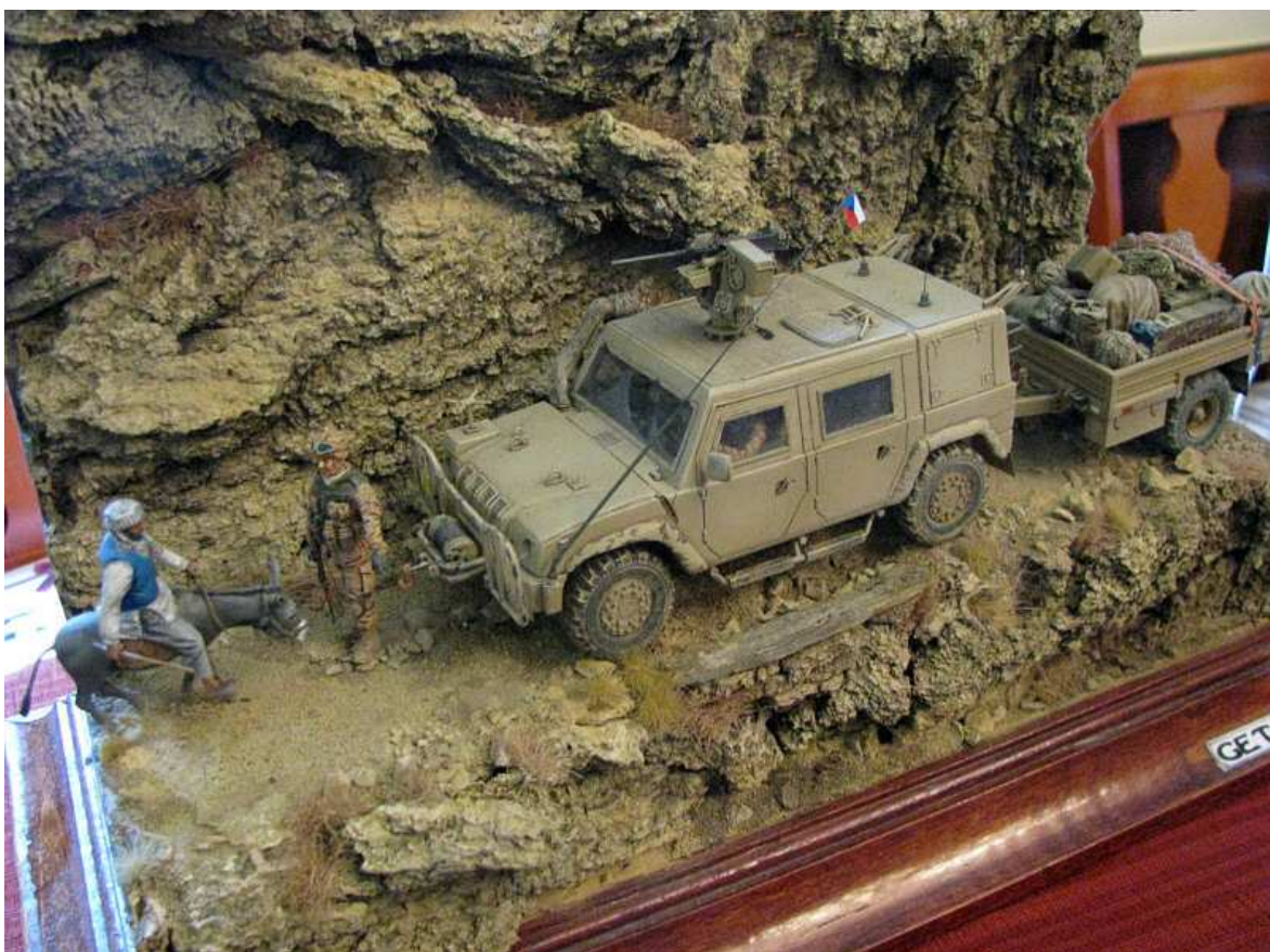
„Get Out!“ Tolles Diorama eines tschechischen Modellbauers