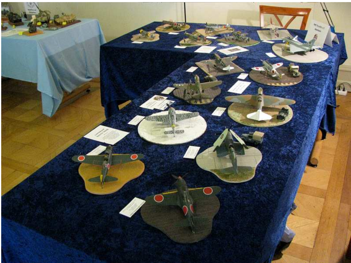
Der Stand des PMC Kurpfalz