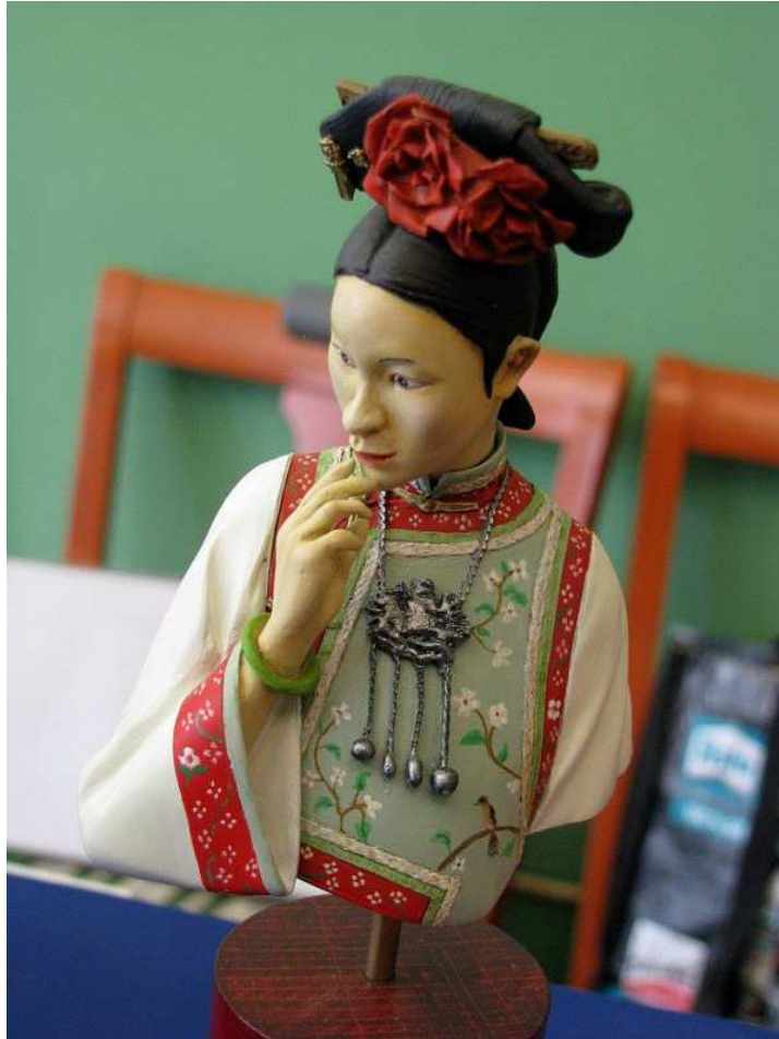
Auch schöne bemalte Figuren gab es zu bestaunen