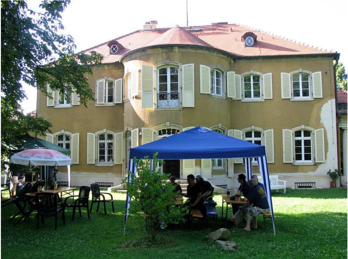
Rückansicht des Gebäudes mit „Biergarten“