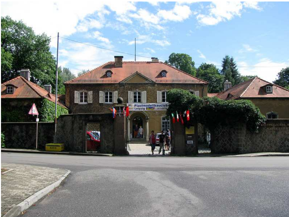
Das Westphalsche Haus in Markkleeberg