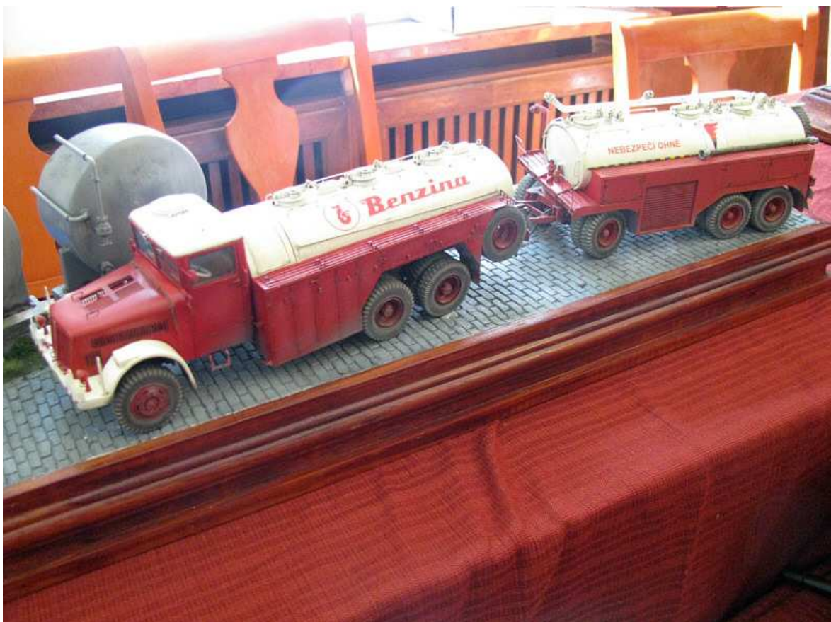
Alter Tatra Tankwagen