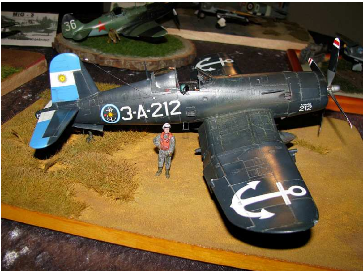
F4U der Argentinischen Marineflieger