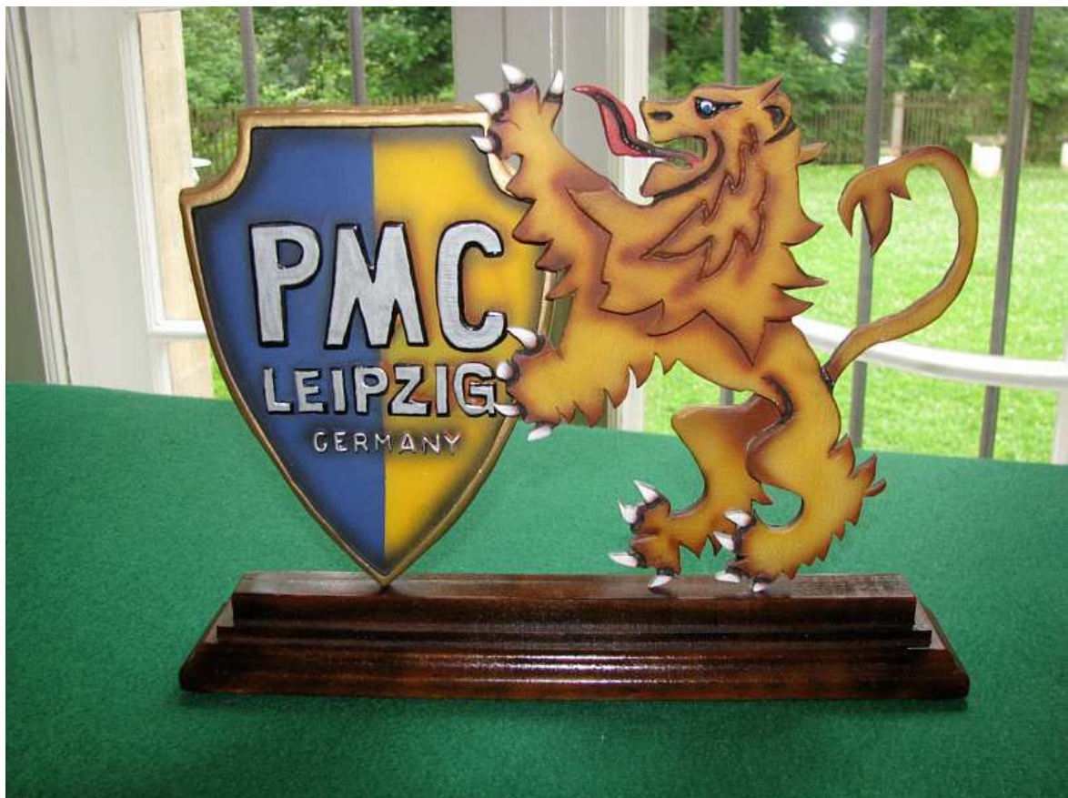
Der gastgebende Verein