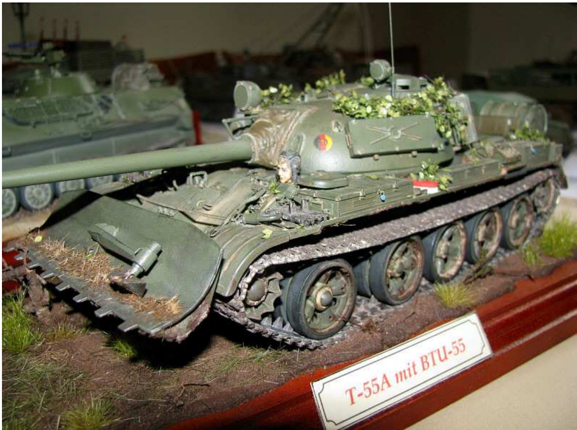
Kettenfahrzeuge der ehemaligen NVA durften natürlich auch nicht fehlen