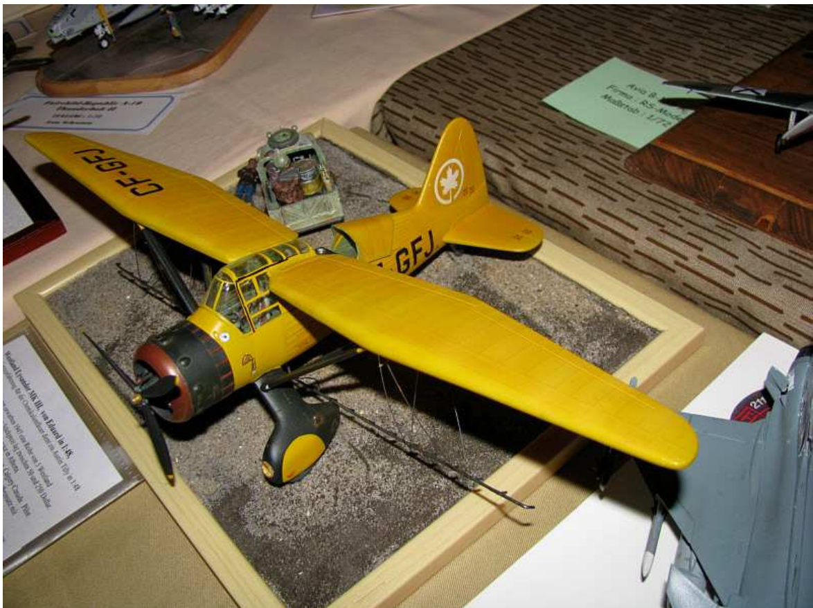
Zivile Westland Lysander