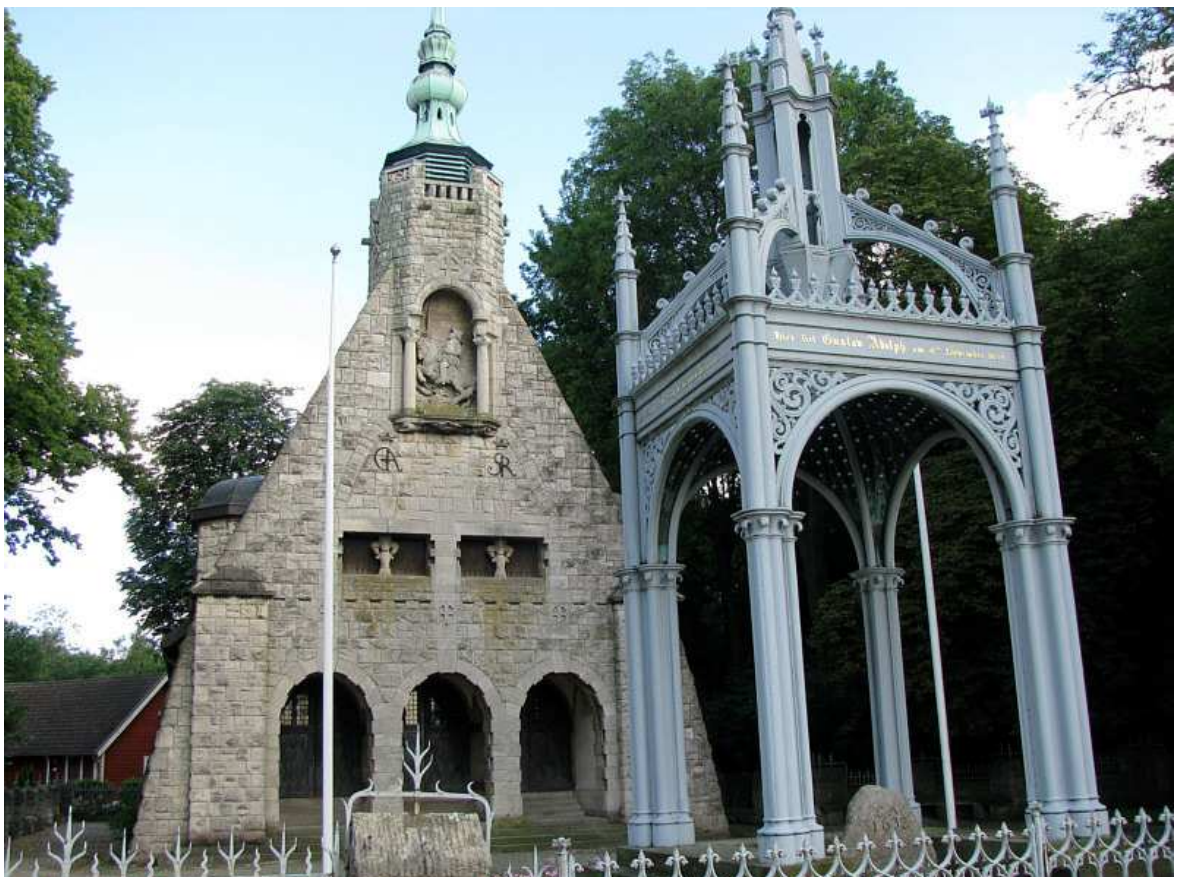
Die Gustav-Adolph-Gedenkstätte in Lützen bei Leipzig